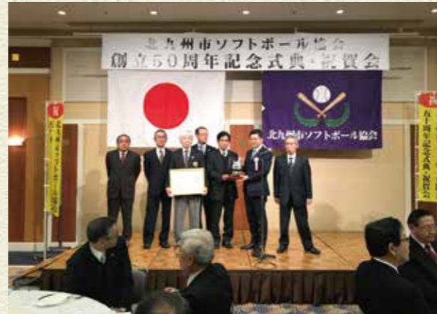
平成29年12月 北九州市ソフトボール協会創立50周年記念式典