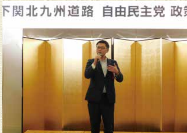
平成29年10月 下関北九州道路 自由民主党政策懇談会