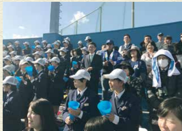
平成29年10月 北筑高校40周年記念事業 八幡南高校との野球部交流戦応援