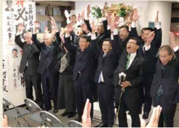
平成29年10月 衆議院選挙 選挙対策本部長として