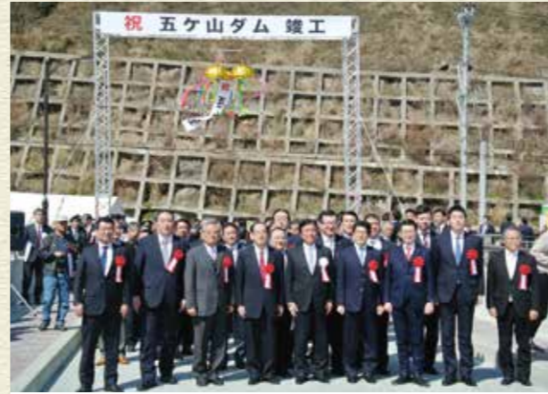
平成30年3月 五ヶ山ダム 竣工式