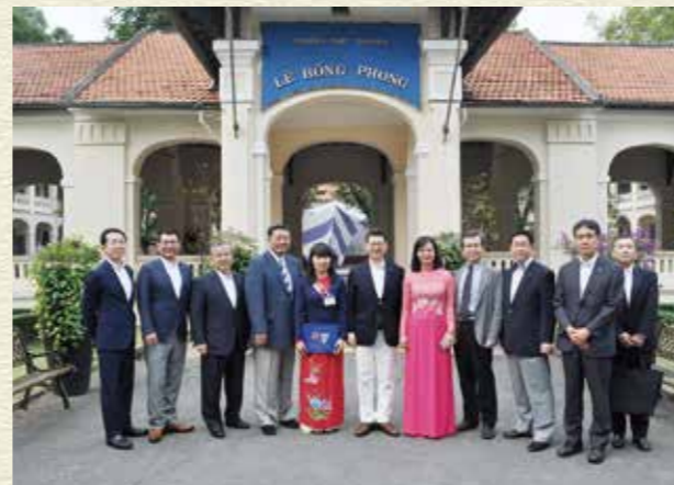
平成30年1月 ベトナム視察 福岡県ベトナム友好議員連盟会長として