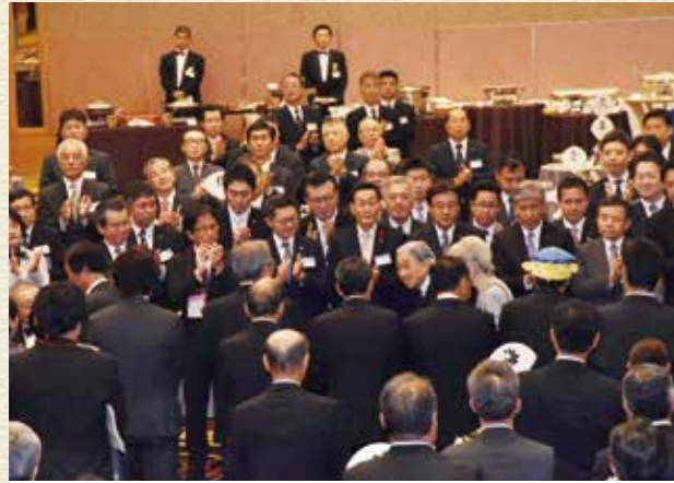
平成29年10月 全国豊かな海づくり大会 天皇皇后両陛下下行幸啓