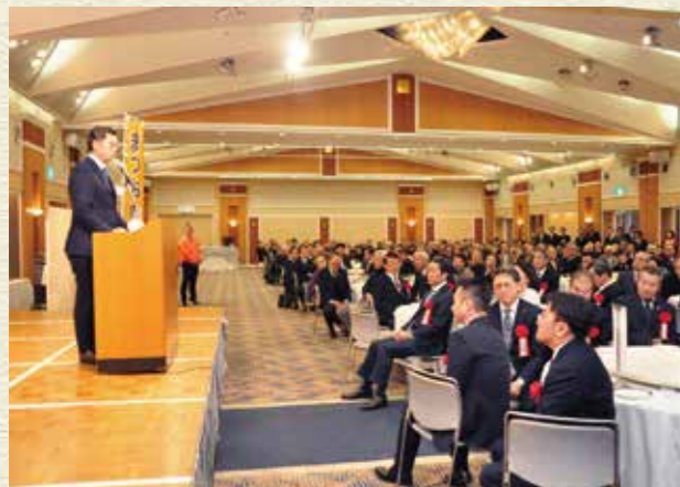
平成29年30月 新春の集い